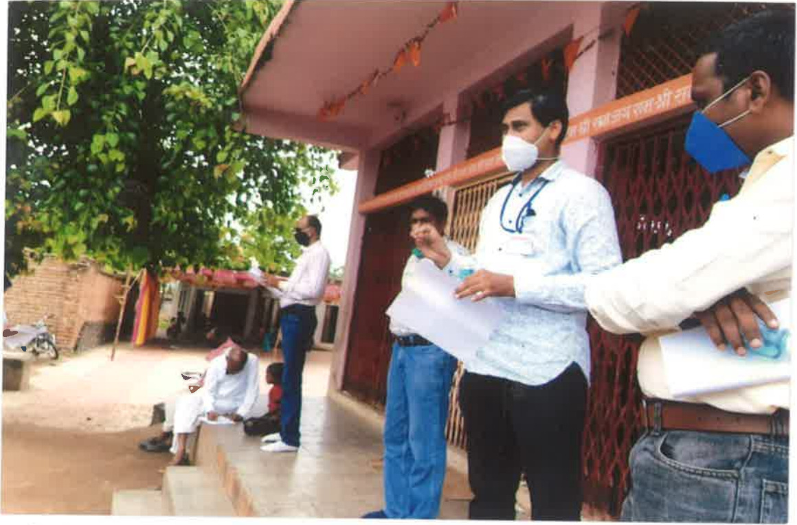
कोरोना महामारी सर्वेक्षण, मोजे येठी