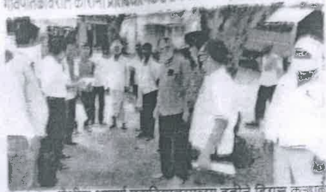
हिंगोली येथील आदर्श महाविद्यालयाच्या वतीने डिग्रस कऱ्हाडे येथे कोवीड-१९ बाबत सर्वेक्षण करण्यात आल्याने उपस्थित मान्यवर.

देशभर मागील काही महिन्यांपासून धुमाकुट घालणाऱ्या कोरोना विषाणु बाबत लोकांमध्ये कितीपत जनजागृती झाली, तसेच प्रशासनाने कोरोना विषाणुना पायबंद करण्यसाठी कायकायच्या उपयोजना केल्या पाहून विद्यापीठ अनुदान आयोगाने महाविद्यालय विद्यापीठाना सर्वेक्षण करण्याचे आदेश दिले आहेत या अनुषंगाने हिंगोली येथील आदर्श महाविद्यालयाच्या वतीने हिंगोली तालुक्यातील डिग्रस कऱ्हाडे येथे सर्वेक्षण करण्यात आले.