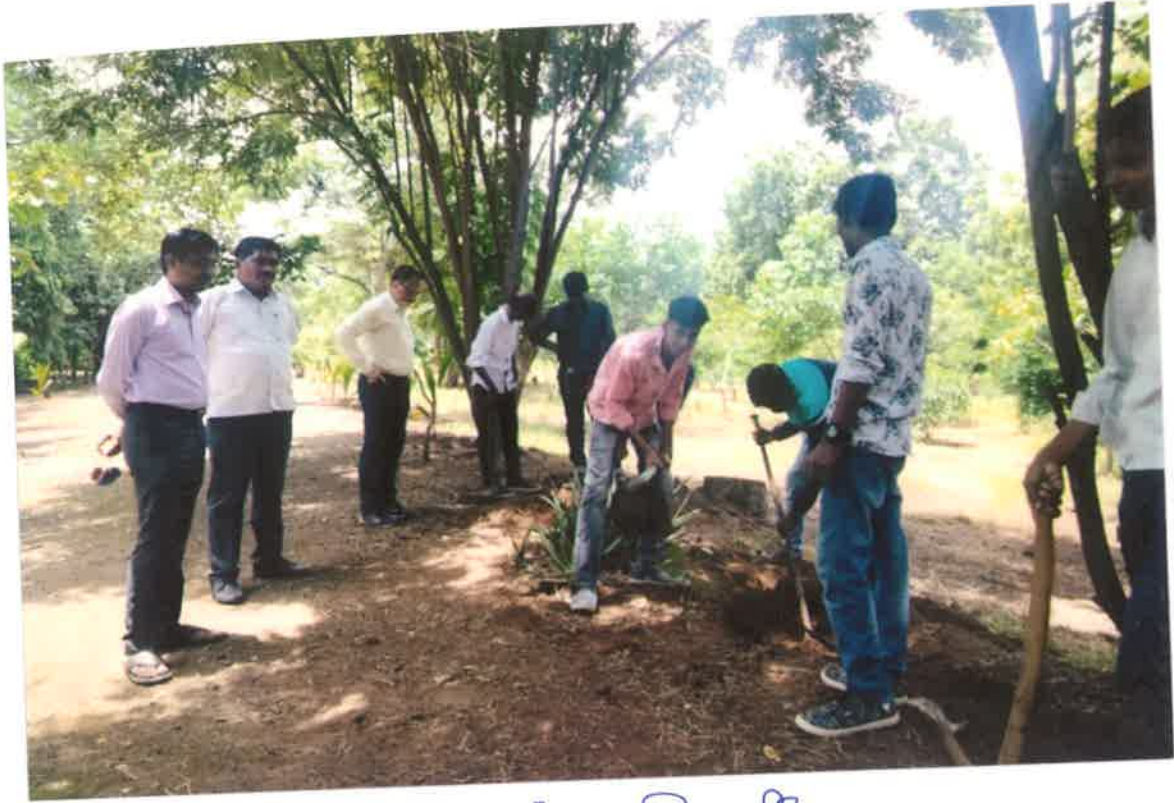
परिेशर स्वच्छता करताना विद्यार्थी