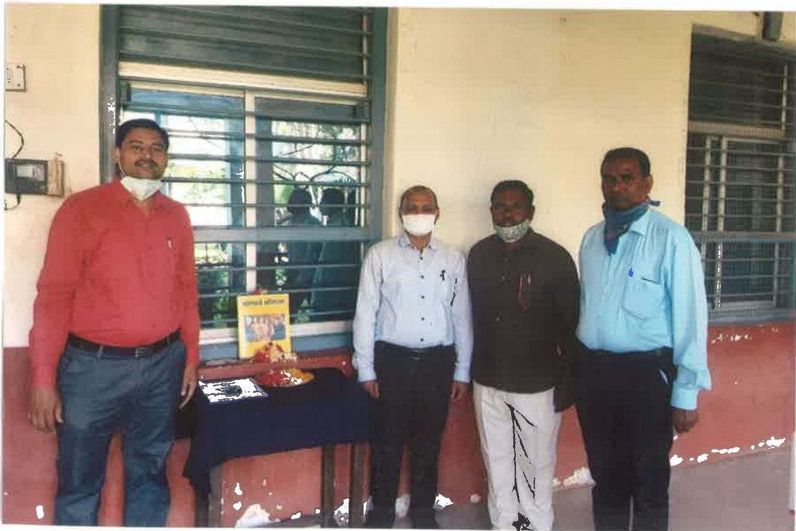
कोरोना महामारी सर्वेक्षण मौजे डिग्रस कहल्ले .