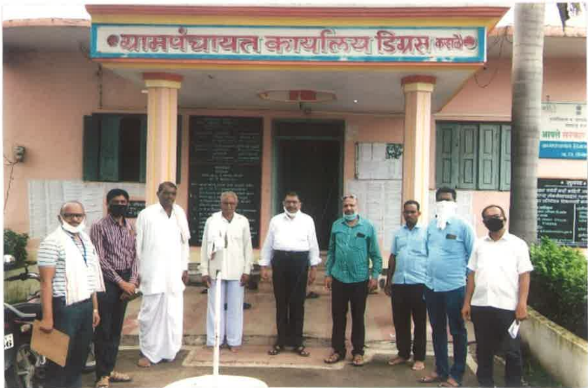
कोरोना महामारी सर्वेक्षण, मौजे डिग्रस क-हाळे