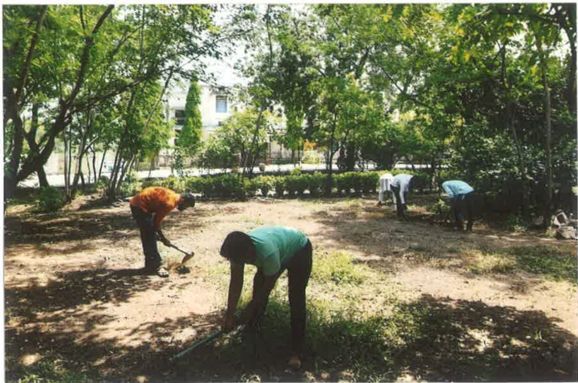
परिेशर स्वच्छता करताना सहभागी विद्यार्थी