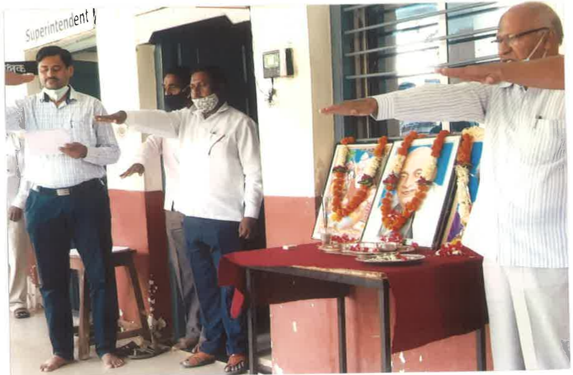
मा. ए.पी.जे. अब्दुल कलाम, माजी राष्ट्रपती, जयंती साजरी करतांना प्राचार्य व कर्मचारी