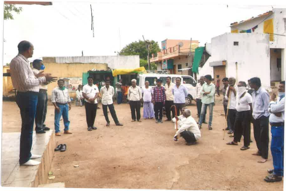
कोरोना महामारी सर्वेक्षण, मोजे येठी